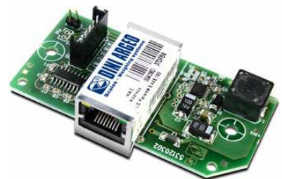
Fig.1 Rete aziendale con contapezzi DFWKP,3590E,CPETF